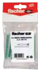
Blandarrör till fill & fix