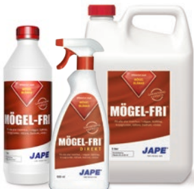
1 liter 0,5 liter 5 liter

Åtgång: 1 liter Prick-Fri utspädd till 5 liter brukslösning räcker till ca 25 m 2 .