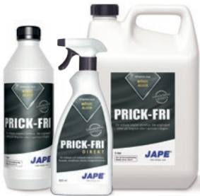
1 liter 5 liter

En serie effektiva desinfektions- och rengöringsmedel från Jape. Väljer du dessa produkter får du ett heltäckande system för underhåll av fasader och andra ytor. Samtliga produkter är biologiskt nerbrytbara.