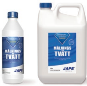
1 liter 5 liter

Åtgång: 1 del Underhållstvätt spädes med 20 delar vatten. 1 liter brukslösning räcker upp till 15 m 2 .