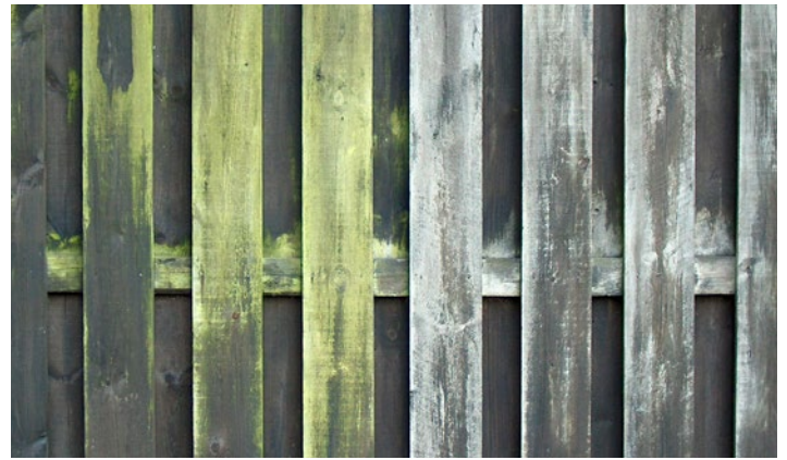
Målat träplank med angrepp av gröna alger. Ett dygn efter behandling av Grön-Fri. Inget efterarbete.