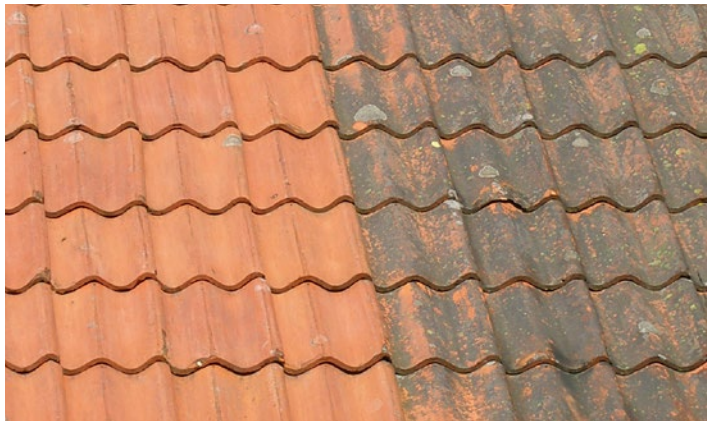
Tak av tegelpannor med angrepp av alger och lav. 2 år efter behandling av Grön-Fri. Inget efterarbete.