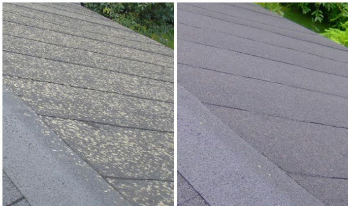
Tak av papp med angrepp av lav. 3 år efter behandling av Grön-Fri. Inget efterarbete.