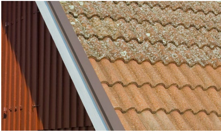
Tak av betongpannor med angrepp av lav. Två år efter behandling av Grön-Fri. Inget efterarbete.