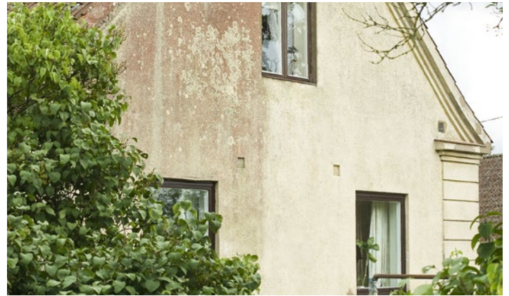
Putsad fasad med angrepp av rödalger. 4 månader efter behandling av Grön-Fri. Inget efterarbete.