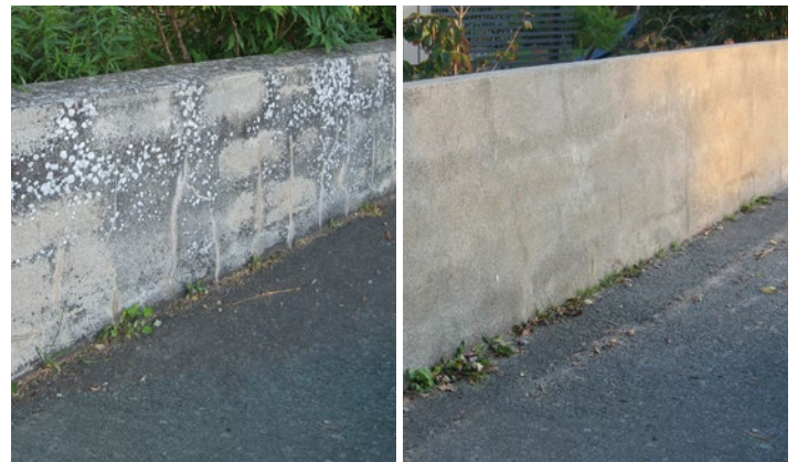
Putsad mur med angrepp av lav behandlad med Grön-Fri. Inget efterarbete. Vänster: Innan behandling. Höger: 4 år efter behandling.