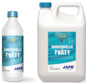
1 liter 5 liter

Åtgång: 1 liter Møgel-Fri brukslösning (spädes ej) räcker till ca 5 m 2 .