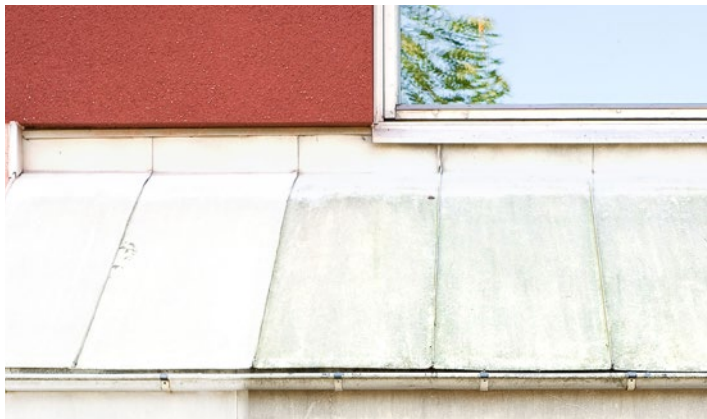
Plåttak med angrepp av alger. 12 månader efter behandling av Grön-Fri. Inget efterarbete.