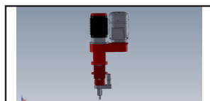
Aerfast elektrisk spik-tryckare 50-90mm