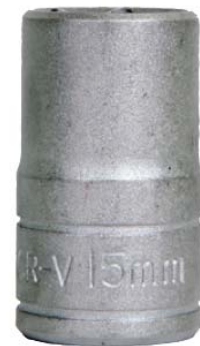
Art. nr. 9996920