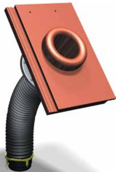
Ovan: Avloppsluftare Carisma i betong komplett.