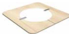
Till vänster: Vid lätt undertak, använd monteringsbeslag. Samma produkt används vid både 1- och 2-kupigt.